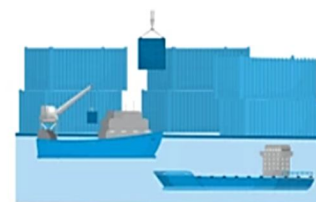
3) رشد تجارت ASEAN