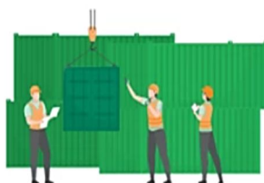
2) دینامیک‌های تجارت چین