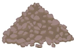
1) تیگرگی تجارت روسیه - غرب

3. رشد تجارت ASEAN: جنوب شرق آسیا بزرگ‌ترین برنده نقشه جدید تجارت جهانی خواهد بود. این منطقه شاهد افزایش قابل توجهی در تجارت با چین، ایالات متحده، ژاپن و اتحادیه اروپا خواهد بود که ناشی از تمایل شرکت‌ها برای تنوع‌بخشی به زنجیره‌های تأمین جهانی در مواجهه با تنش‌های ژئوپلیتیکی رو به افزایش و هزینه‌های بالای تولید در چین است. تجارت ASEAN با چین به میزان 438 میلیارد دلار افزایش خواهد یافت که بزرگ‌ترین افزایش بین منطقه‌ای در نقشه 2031 گزارش حاضر است. شرکت‌ها به دلیل هزینه‌های پایین‌تر و گسترش و عمق روزافزون قابلیت‌های تولیدی این منطقه، به جنوب شرق آسیا جذب خواهند شد (قابل مشاهده در شکل 2).